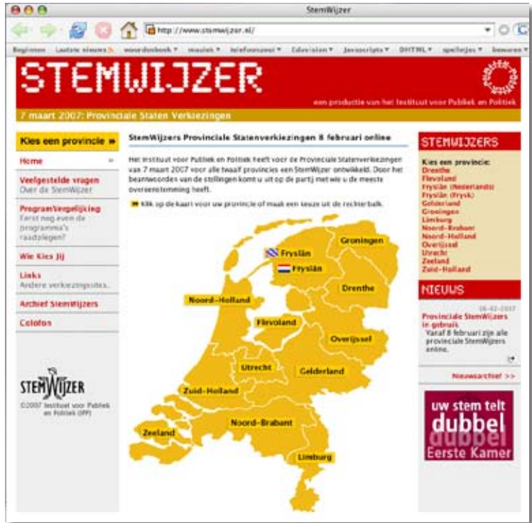
Indien u meer informatie wilt over de verkiezingen surf dan naar www.stembijzer.nl .

De Commissaris van de Koningin is zowel voorzitter van Provinciale Staten als voorzitter